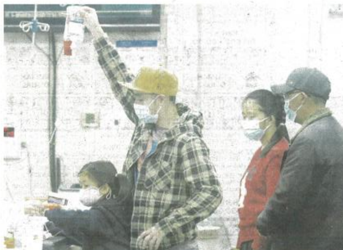
Seorang kanak-kanak sedang menerima rawatan di jabatan pediatrik selepas disahkan dijangkiti virus HMPV di Hangzhou, China.

Bagaimanapun, HMPV berjangkit secara meluas dalam kalangan kanak-kanak kecil berbanding Covid-19. - Agensi