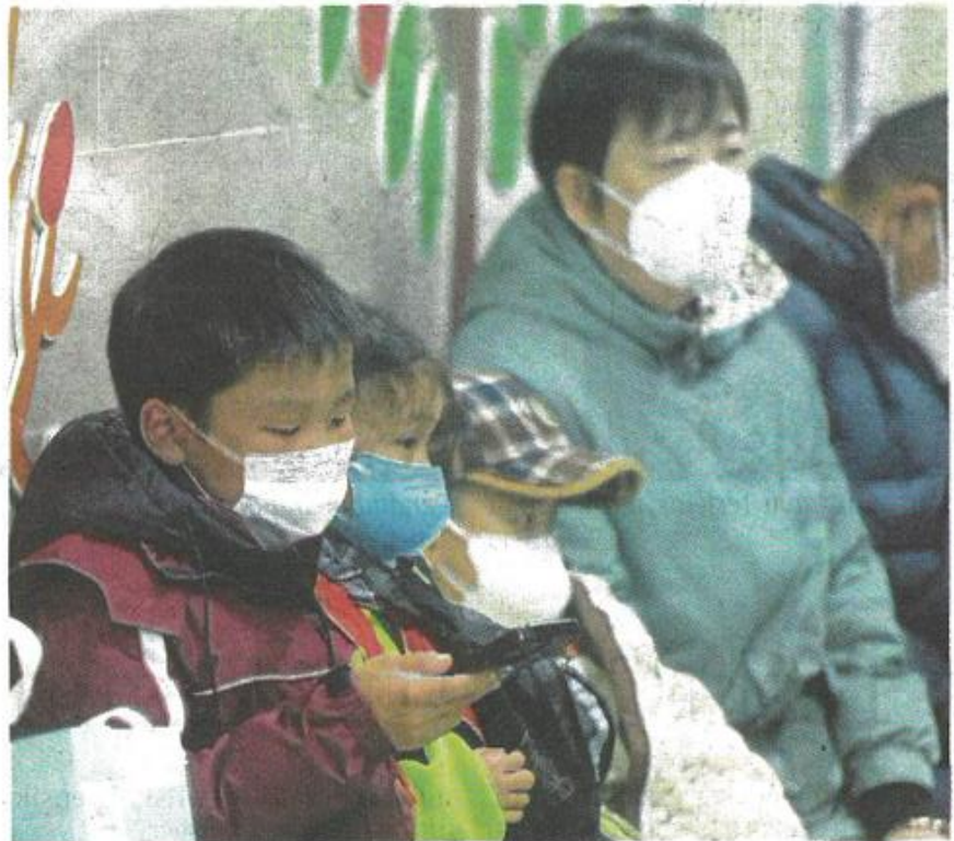
Kanak-kanak menunggu rawatan susulan peningkatan penularan virus pernafasan di hospital Hangzhou, China, Isnin lalu.

"Pihak berkuasa melaporkan penggunaan hospital kini lebih rendah berbanding tempoh sama