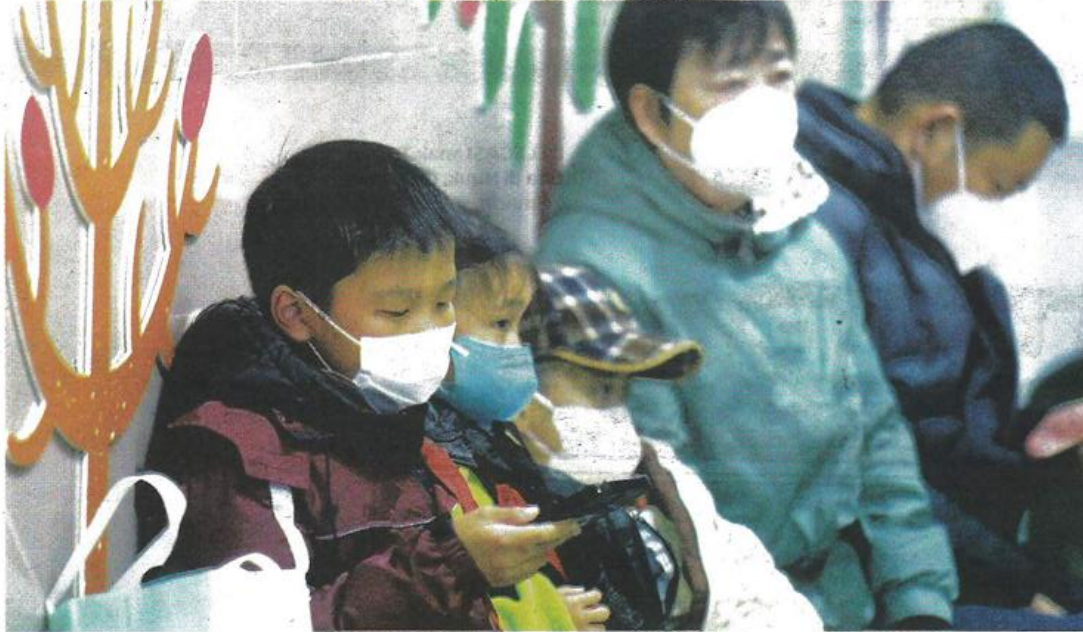
KANAK-KANAK mendapatkan rawatan di sebuah hospital di Hangzhou, China kelmarin.